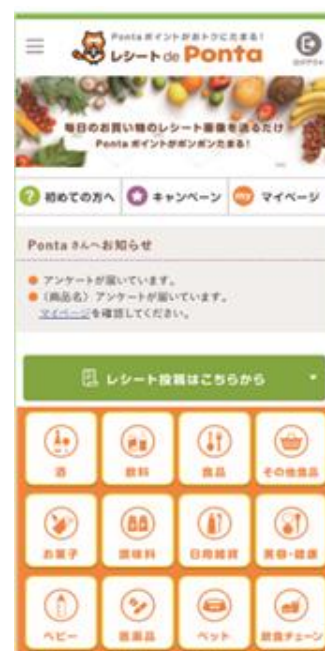
<「レシート de Ponta」画面イメージ>

Ponta 会員の皆様は、本サービスをご利用頂くことで、普段捨ててしまうことのお多いお買い物レシートを撮影・投稿し Ponta ポイントをためることができます。また、商品やサービスの改善に向けて、消費者としての声を直接企業に届けることができます。レシートを投稿すると自動的にデータ化されるため、レシートの内容を入力する手間は掛かりません。